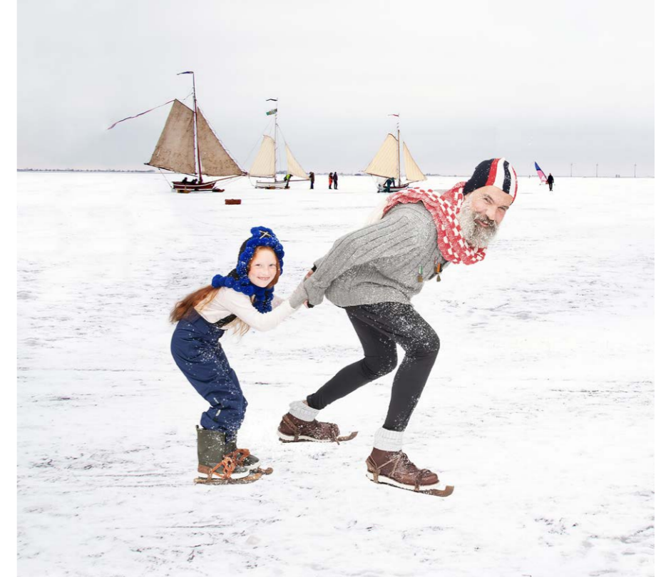
Winterkoorts in het Zuiderzeemuseum

Sprookjeswonderland is tot en met 24 oktober dagelijks geopend. Sprookjeswonderland kun je bezoeken op 18 & 19 december en van 26 december 2021 tot en met 9 januari 2022. Op 31 december sluit het park om 17.00 uur en op Nieuwjaarsdag is het park gesloten. Reserveren door middel van online tickets is verplicht en kijk voor je bezoek ook nog even op de website voor de meest actuele informatie.