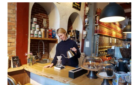
Shoppen in Enkhuizen - Het Coffy-Huys